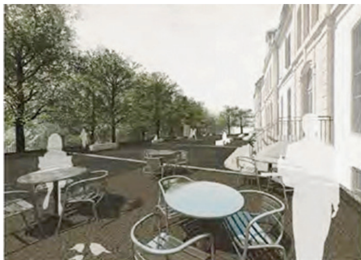
L'esplanade de la gare, destinée à être conviviale! SP