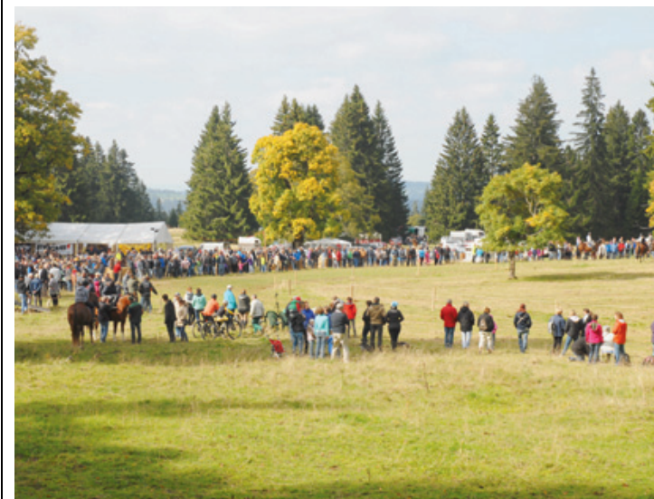
Près de 2000 personnes ont assisté aux épreuves. JOËL REGLI

Au final, elle a pris la 2e place de la course, à une foulée de la gagnante. «Mais c'est surtout pour le plaisir que je le fais, c'était très rigolo», précise-t-elle. Cette formule résume bien l'état d'esprit présent qui a régné lors de cette journée équestre. ○ JRE - RÉD