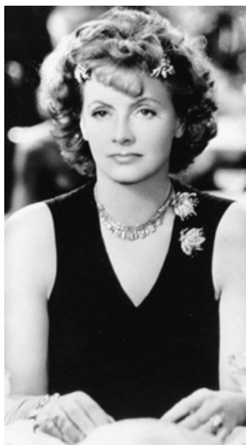
Greta Garbo, inoubliable et hilarante dans «Ninotchka».

Cette saison a déjà pratiquement commencé avec «Le festin de Babette» qui a passé le 19 septembre dans le cadre de la Semaine du goût. D'autres collaborations suivent. Ainsi, une manifestation commune a lieu avec Ciné-Vallée les 24 et 25 octobre: la fête du cinéma d'animation, au Casino, pour le tout public dès six ans! Pas besoin de faire partie du Ciné-club. On peut prendre un billet à l'entrée, pour un prix des plus modique. Autres collaborations: avec la-