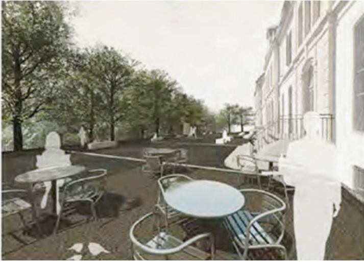
L'esplanade de la gare, destinée à être conviviale! SP