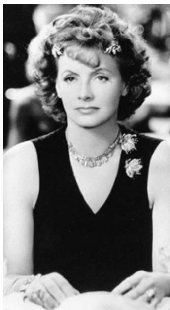
Greta Garbo, inoubliable et hilarante dans «Ninotchka».

Cette saison a déjà pratiquement commencé avec «Le festin de Babette» qui a passé le 19 septembre dans le cadre de la Semaine du goût. D'autres collaborations suivent. Ainsi, une manifestation commune a lieu avec Ciné-Vallée les 24 et 25 octobre: la fête du cinéma d'animation, au Casino, pour le tout public dès six ans! Pas besoin de faire partie du Ciné-club. On peut prendre un billet à l'entrée, pour un prix des plus modique. Autres collaborations: avec la-