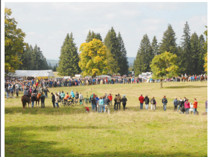
Près de 2000 personnes ont assisté aux épreuves. JOËL REGLI

Au final, elle a pris la 2e place de la course, à une foulée de la gagnante. «Mais c'est surtout pour le plaisir que je le fais, c'était très rigolo», précise-t-elle. Cette formule résume bien l'état d'esprit présent qui a régné lors de cette journée équestre. ● JRE - RÉD